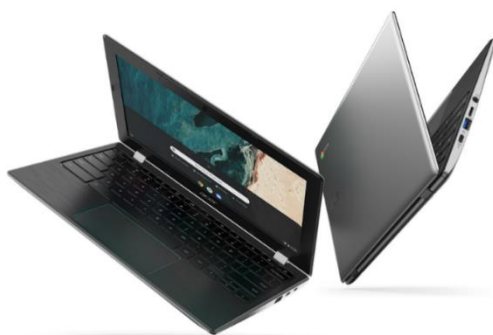
Acer Chromebook 311